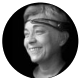
Dorothé #neuroscience #collaboration #innovation