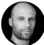
Mathieu #innovation #intelligence collective #design thinking