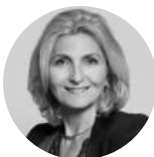
Sevdia #leadership #intelligence collective #management