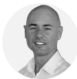
Jeffrey #women empowerment #gestion du stress #intelligence émotionnelle