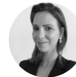
Maud #management #collectif #innovation #changement