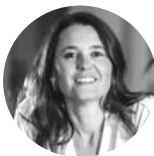
Carole #futur of work #diversité #inclusion #transformation digital