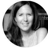
Séverine #affirmation de soi #gestion de projet #communication #management