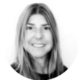
Isabelle #Intelligence artificielle #transformation digital