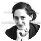
Magali #innovation #transformation #futur of work