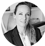
Ines #inclusion #diversité #mixité #RSE