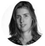
Annabelle #designthinking #design #innovation #créativité