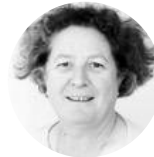
Fabienne #économie circulaire #eco-conception #innovation