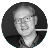
Gilles #management #transformation #conduite du changement