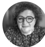
Laurence #communication #management 3.0 #accompagnement et entrepreneuriat #Stratégie de transformation