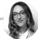
Agathe #storytelling #intelligence collective #design thinking